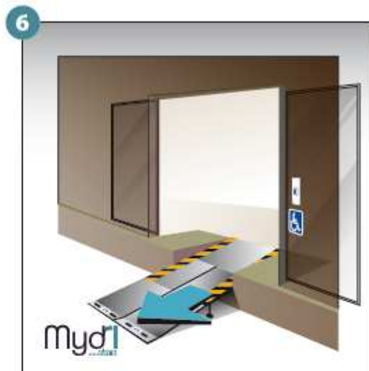
6 - Répéter les opérations pour le deuxième volet